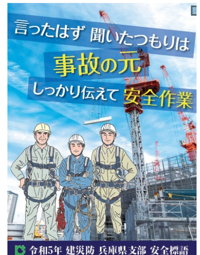
昨年度最優秀作品のポスター