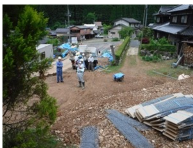
社内安全パトロール (協力会社合同パト)